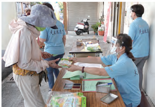
▲互愛物資銀行物資發放，在謹遵政府防疫規定下，有條不紊地進行。