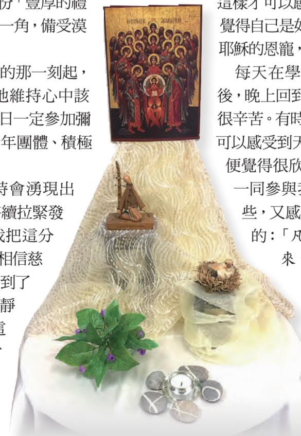
▲溫馨宜人的祈禱空間，引人與天主深入交融。

只有在天主內，才能找到安慰和喜樂，世上的一切，是無法滿足這份渴望的；只有真正地感受到來自天主的那分，才有能力去服務他人，與他人分享這分大愛。