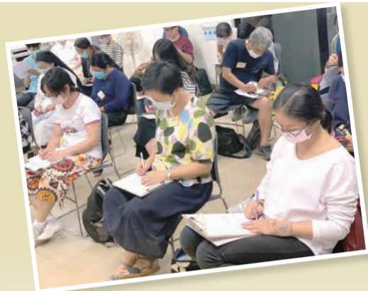
▲課程除了增進教理教學技巧，也幫助學員溫故知新，實踐信仰。