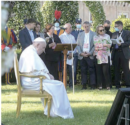
▲教宗方濟各在梵蒂岡花園帶領玫瑰經