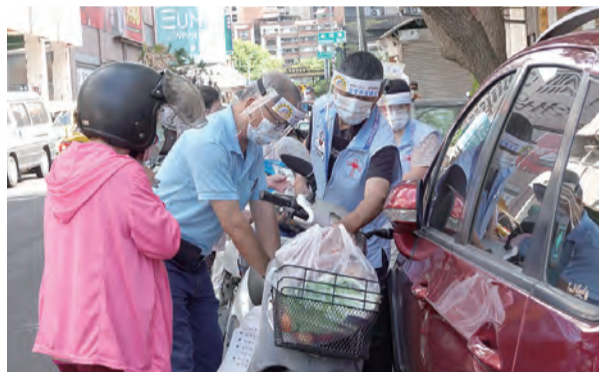
▲互愛物資銀行志工協助關懷戶將物資搬運上機車，服務無微不至，令人「足感心」！

為使當天在精簡人力下的流程更加順暢，減少服務對象停留時間，物資分裝打包工作在幾天前即開始進行，除了米、鹽、油、麵條、罐頭等民生用品外，台中教區也準備了印有紀念教區成立60周年慶logo的口罩送給關懷戶，讓大家隨時做好防疫措施，保護自己也保護他人。