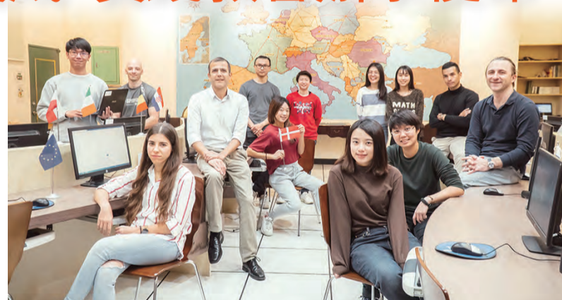
▲文藻外語大學「全英語授課」數，已達495門。

文藻轉型為大學後，除增設科系，獎勵教師開辦全英語課程。從2014年開始，文藻外大全英授課數已達495門，科目遍及四大學院各系、所、中心，例如：兒童英語讀寫教學、德國文化、基礎西班牙文、歐洲經貿專題、國際整合