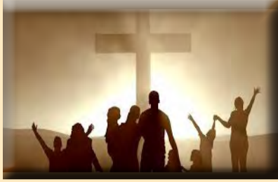
堂區走向社區，準備好了嗎？