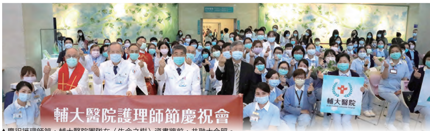
▲慶祝護理師節，輔大醫院團隊在〈生命之樹〉盜畫牆前，共融大合照。

心思意念隨著樂曲〈When You Wish Upon A Star〉波動迴盪，歌詞中的「Like a bolt out of the blue, fate steps in and sees you through, When you wish upon a star, your dreams come true. / 突如其來的晴天霹靂，命運中的每一步看著你；當你對著星星許願，你的夢想會成真。」的確，生命過程中總有預期外的經驗，如同霹靂般（Bolt）讓事物轉化、成就！看著舞台上醫護同仁同心慶祝的活力，對照於輔大醫院一樓大廳的活動場域正後方，一整面牆上的法藍精盜照壁〈生命之樹〉（創作靈感來自《默示錄22：2）與眾多恩寵果實意象，此時，那顆星更持續帶領著我們（參閱瑪2：2-10），正如「我耶穌派遣了我的使者，給你們證明了有關教會的這些事。我是出於達味家族的後裔，我是那顆明亮的晨星。」（默22：16）