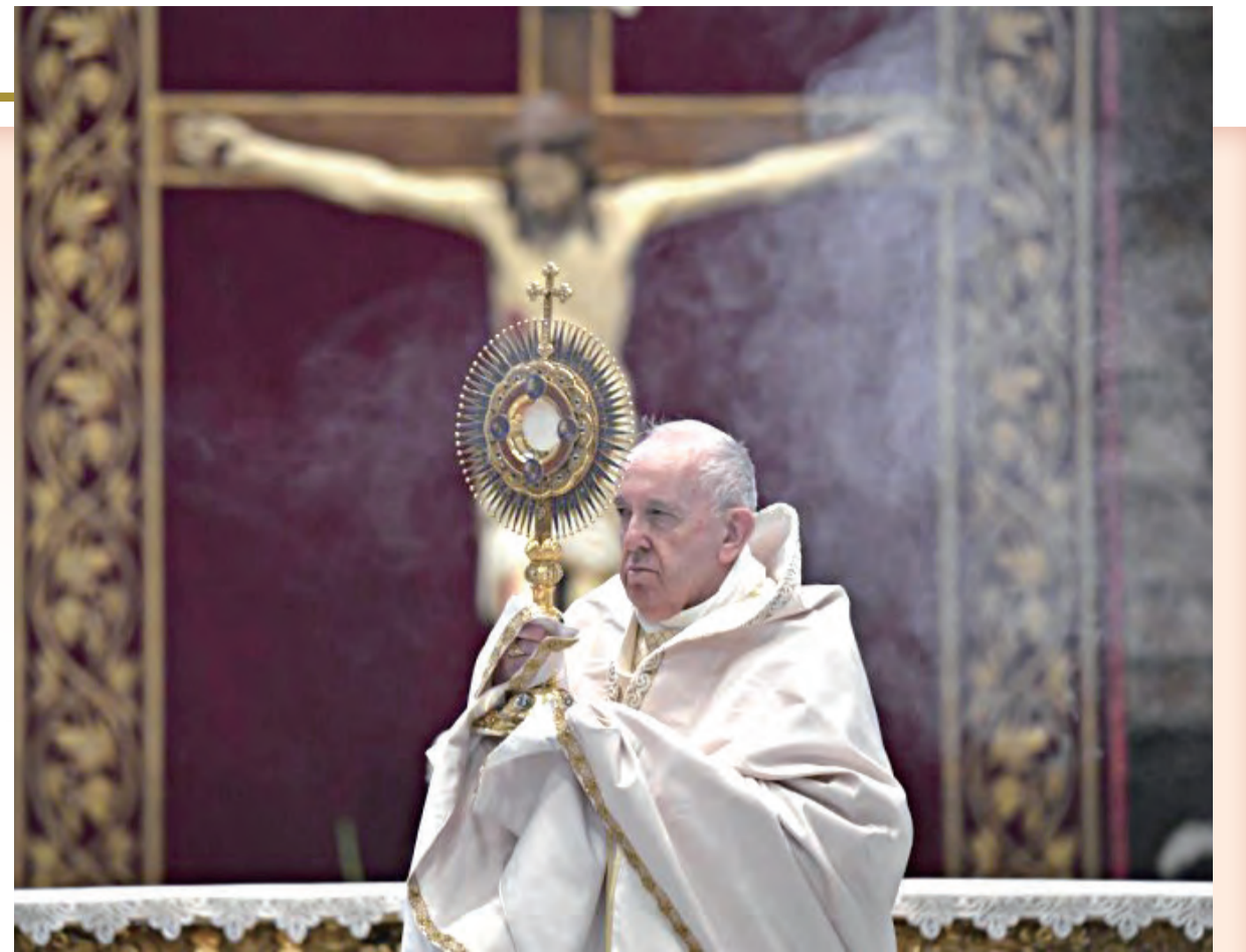
▲教宗方濟各呼籲全球信友在基督聖體聖血節前一晚，同步敬禮聖體1小時祈禱。

答：信友藉聖洗脫離了自己的罪過，並加入教會；藉聖洗而領受的聖事印記，使人有分於基督宗教的敬禮；因著王家司祭的職務，恆心祈禱、讚頌天主，好成為生活、聖潔和悅樂天主的祭品，所作所為無可指謫，時時處處為基督作證，並向那些詢問他們的人，說出他們所懷永生希望的理由。為此，教友參與感恩祭和教會其他禮儀時，不能只是一種身體的臨在，更不應是被動的，卻該是信仰及源自洗禮身分的真正實踐。(救37)