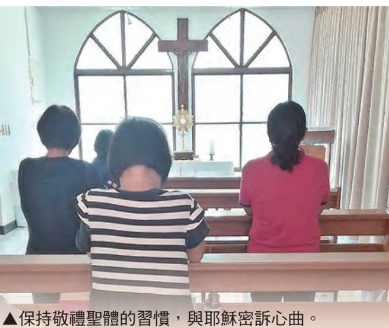
▲保持敬禮聖體的習慣，與耶穌密訴心曲。