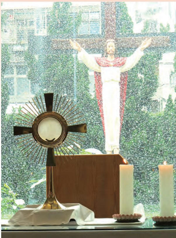
▲北投聖高隆邦堂依往例開放24小時明供聖體，教友們可以單獨前往聖體敬禮，但須遵守防疫規定作實名制登記並在祈禱時全程配戴口罩，做好防護。

為此，在彌撒慶典中，不加選擇地使用日常或普通的器皿，尤其是毫無藝術價值的，或簡單的容器，或以玻璃、陶土、黏土等易碎的質料做成的器皿，這種做法須予以廢止。至於彌撒聖祭中使用的聖布，牧者該注意此些聖布常保持雅潔，尤其是直接接觸聖體聖血的布，