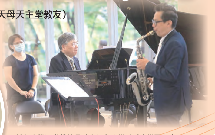
▲輔仁大學江漢聲校長（中）與音樂系爵士樂團在慶祝活動中，合奏迪士尼電影〈木偶奇遇記〉經典歌曲。