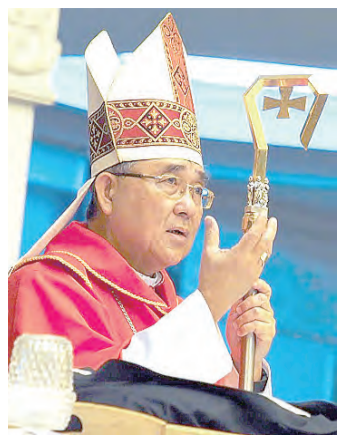
▲汶萊達魯薩蘭國沈高爾內略樞機，5月29日與世長辭。