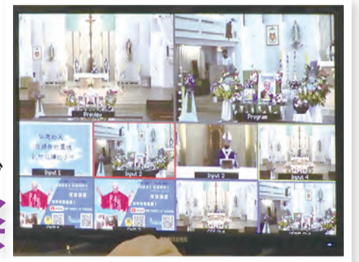
▲殯葬彌撒後，隨即舉行告別禮，隆重且溫馨。