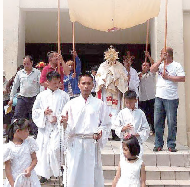
▲在往年基督聖體聖血節所舉行的社區聖體遊行，帶動信仰走出去的福傳。

己的生活。這慶典的本質是在以卓越的方式，奧妙地表達和實現與天主生命的共融，及天主子民的合一。(救11)