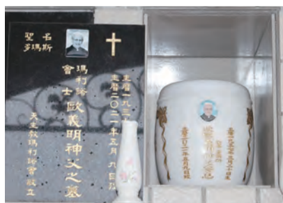
▲歐神父長眠於大直公墓司鐸公塔內