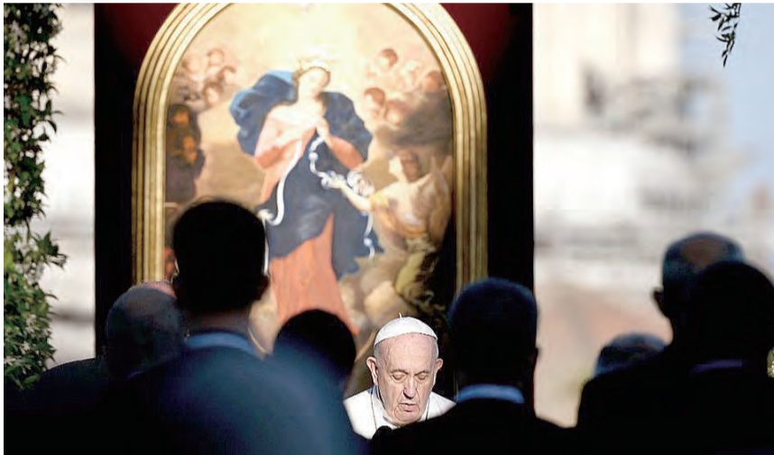
▲教宗方濟各祈求解結聖母解開世人諸多紐結